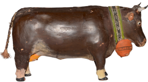
Christian Lötischer, Kuh, um 1850, Privatbesitz Jenaz, Foto Andreas Heege

Hinweise auf Restaurants und Hotels: www.pany-stantoenien.ch und www.praettigau.info , Prättigau Tourismus, Tel. 081 325 11 11