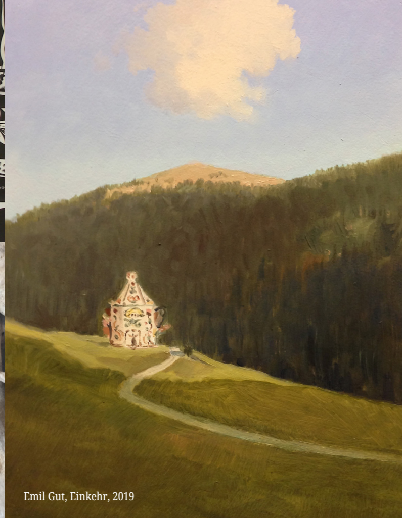
Emil Gut, Einkehr, 2019