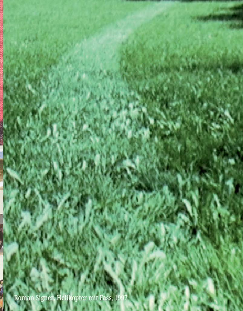
Roman Signer, Helikopter mit Fass, 1997