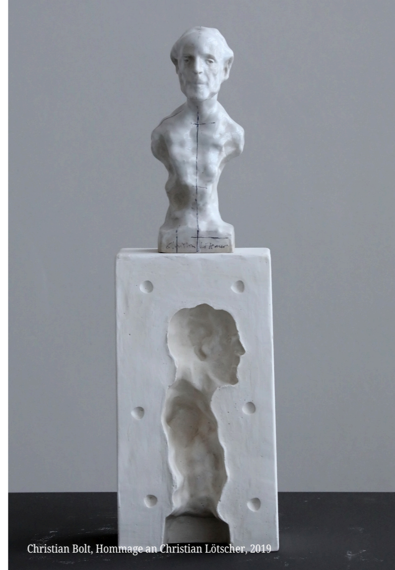
Christian Bolt, Hommage an Christian Lötischer, 2019