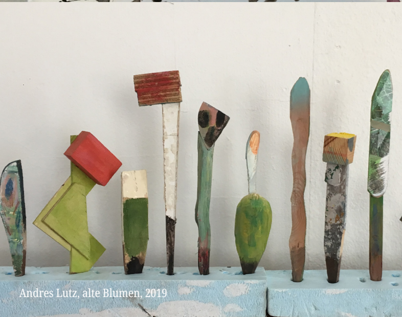
Andres Lutz, alte Blumen, 2019