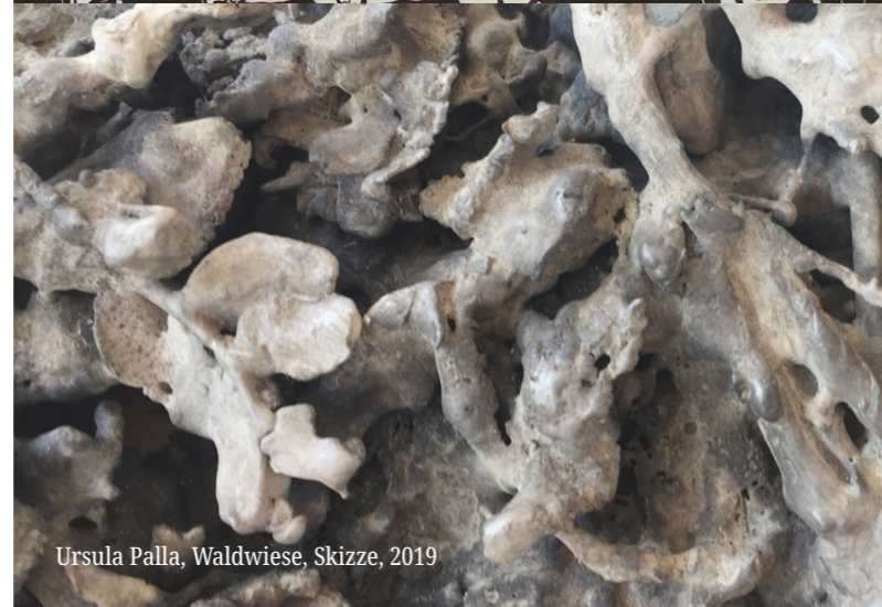
Ursula Palla, Waldwiese, Skizze, 2019