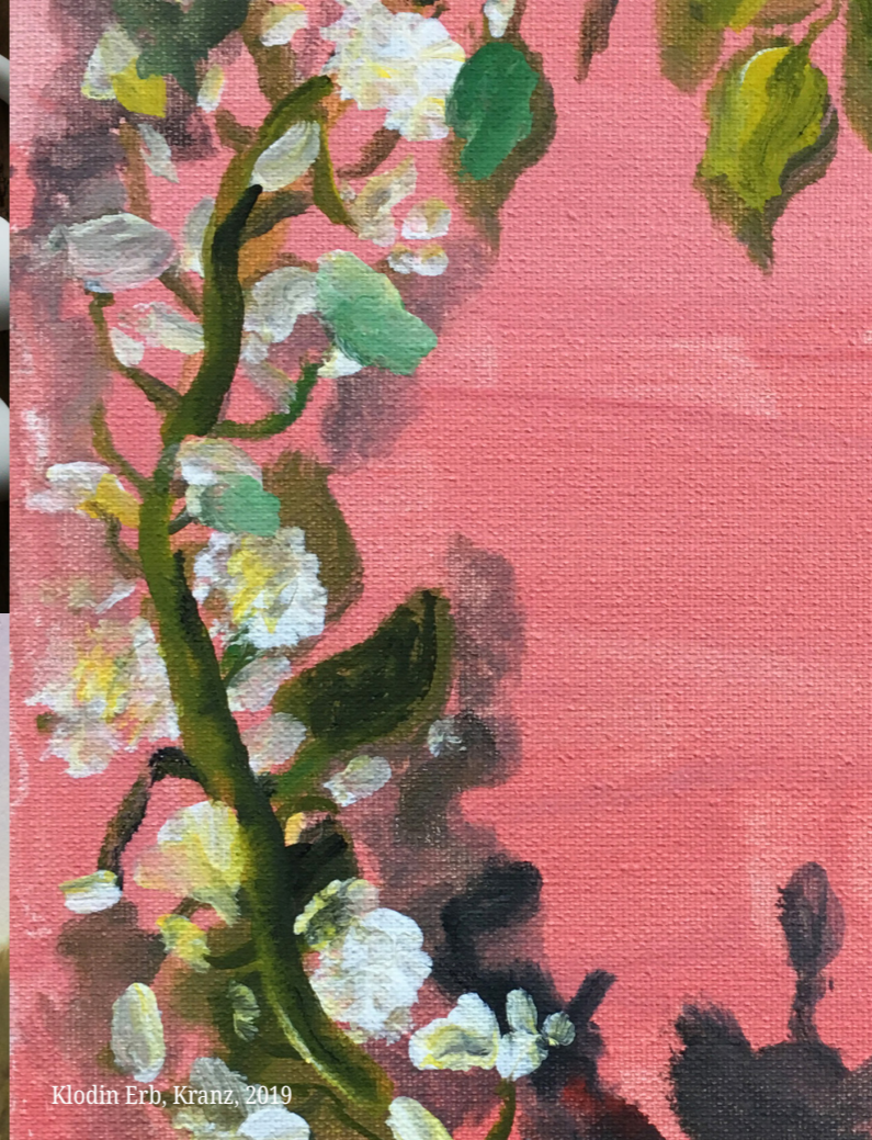
Klodin Erb, Kranz, 2019